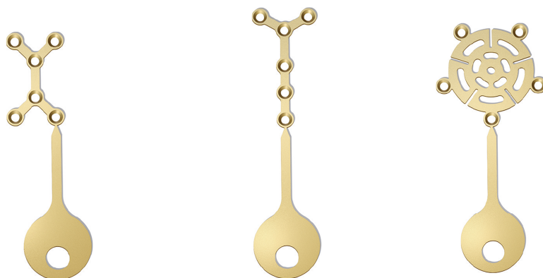
13-000102 Placa micro Y dupla 6 furos L=15mm; T=0,6mm Ti; PU=1 (1x1 peças)