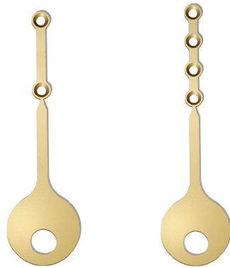
13-000108 micro placa, reta 2 furos L=14mm/ T=0.6mm

Micro: 1.5mm Espessura da placa: 0.6mm Material: titânio.